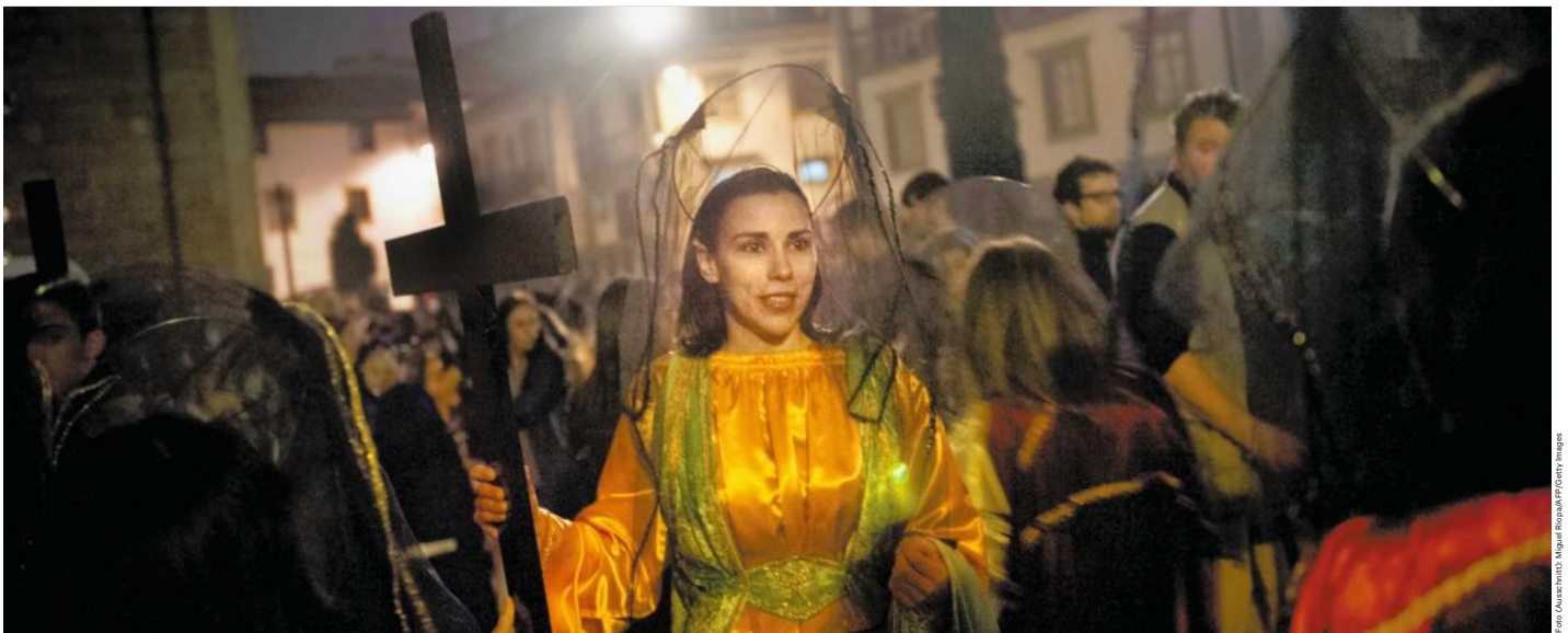
Eine Büferin erwartet die Prozession